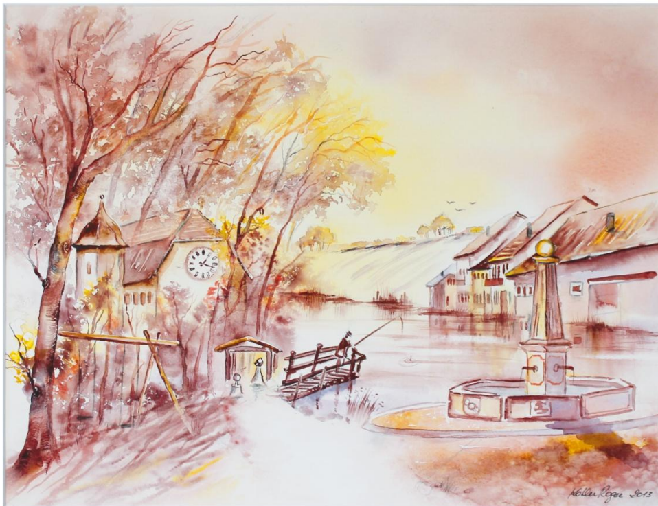
Aquarelle réalisée par Roger Kohler